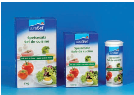
Sale da cucina fluorato e iodato.

I fluoruri sono presenti in piccole quantità nell'acqua potabile e negli alimenti. La loro concentrazione è però troppo bassa per poter proteggere i denti dalla carie. Per prevenire in maniera efficace la carie, dal 1983 in Svizzera è in vendita il sale da cucina iodato e fluorato (JuraSel: pacchetti con la striscia verde, contenenti lo 0,025% di fluoruro). Come misura di prevenzione di base si consiglia inoltre l'uso giornaliero di un dentifricio fluorato.